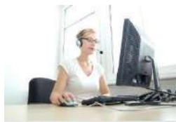
TECHNICAL AND COMMERCIAL