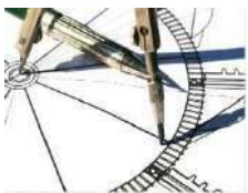
RESEARCH AND DEVELOPEMENT