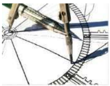
RESEARCH AND DEVELOPEMENT